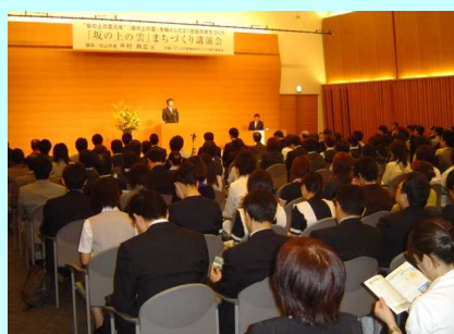
質疑応答を含めた約1時間の講演は大盛況でした！