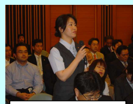
質問する組合員さん